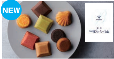
福田屋初登場 フィンシエやマドレーヌが絶品 <ブルミッシュ>