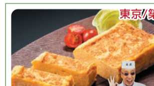
東京/築地 丸武 ①江戸前玉子焼(1本) 各日100本限り 税込1,296円