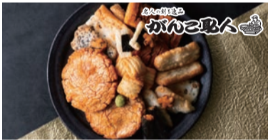
地元がんこ取人の集大成 リニューアルして登場 <がんこ取人>