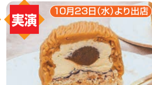
茨城/フランス料理トルテュ ①笑っちゃうほど美味しいモンブラン (130g、1個) 税込972円