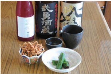
左:「田舎太打ち」と「二八」を一度に味わえる「二色もり(1,200円)」 右:そばの実入りの味噌を大葉で包んだ「そば味噌」と「揚そば」