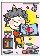
下野新聞社キャラクター「どっどこちゃん」