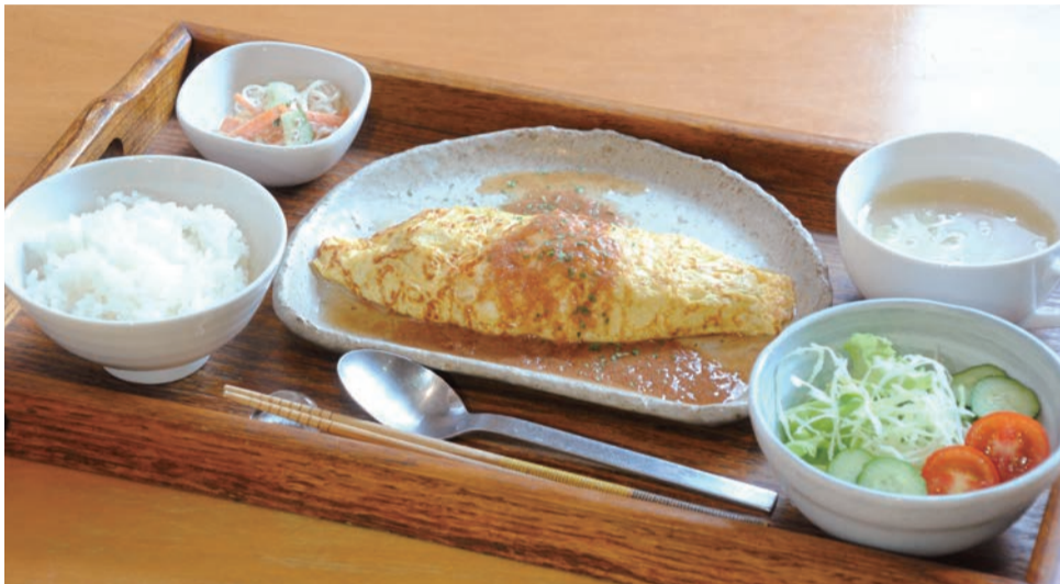
日替わりランチ「ひき肉とチーズのオムレツ(サラダ・スープ・ご飯・小鉢付・750円)」