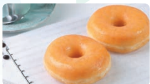
札幌市/LA PANADERIA DOTS プーンタイプのドーナツをシュガーグレイズド(氷砂糖の砂糖)でコーティングしました。シンプルながらも高級感あふれるドーナツです。①グレイズド・ドッツ (1個) 税込300円