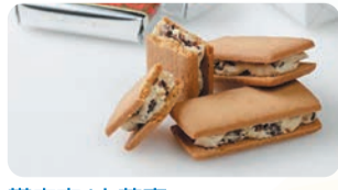
帯広市/六花亭 専用の小麦粉でつくったビスケットで、ホワイトチョコレートとレアチーズ、北海道産生乳100%のクリームを合わせたクリームをサンドしたロングセラー商品です。①マルセイバターサンド (5個入) 税込780円