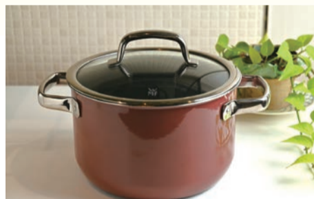
ハイキャセロール20cm (ローズクォーツ) 29,700円

天然鉱石から生まれたミネラル素材を採用。素材そのもののおいしさを短時間で引き出す高機能で、料理をもっと味わい深く。焦げ付きにくくお手入れも簡単。