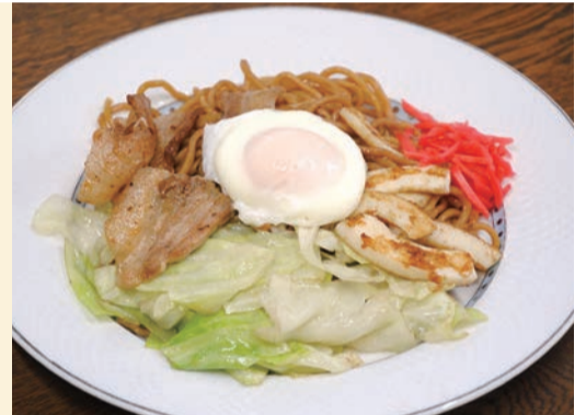
一番人気の「ミックス(全種類の具材入り)普通盛り(810円)」 ※盛付け例(テイクアウトのみ)

「具材それぞれを一番おいしい焼き加減で提供したい」と、甘みのある新鮮なキャベツ、刺身用イカのやわらかい胴の部分、たっぷり豚バラ肉を鉄板の上で別々に炒めて、ソース味に炒めた麺の上に盛付ける。玉子は「ヘルシーでおいしいから」と、お湯に落とすポーチドエッグなども先代のレシピ通り。「キャベツだけ多く」のように、50円単位で各具材や麺の増量、玉子の固さ(通常は半熟)の注文に丁寧に応じてもらえるのも「あをやぎ流」です。電話予約をしてから訪れるのがお勧めです。