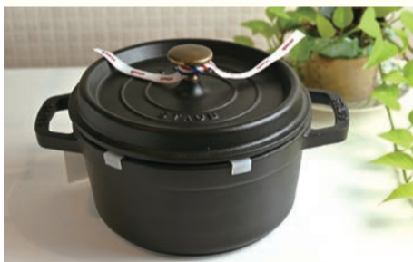
ラウンド20cm (ブラック) 30,800円

熱伝導・保温性に優れた鋳物ホーロー鍋。独自の仕組み「アロマ・レイン」で水分が絶えず循環。食材のおいしさを逃さず、ふっくらジューシーな仕上がり。