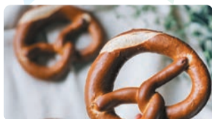
札幌市/プレッツェリア プーンタイプのプレッツェルの中に、発酵バターをフィリングしました。濃厚で味わい深い(ウー)は少しだけ塩めると、とろとろしてとても美味。一番人気商品です。①バタープレッツェル (1個) 税込460円