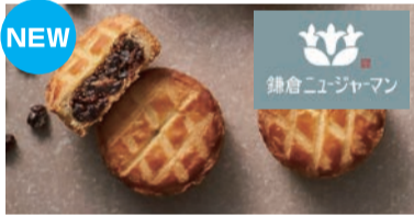
ついに栃木県初登場の月鏡 <鎌倉ニュージャーマン>