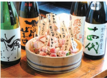
左:「ロールキャベツ 黒(パンorライス付・1,100円)」 「里芋の唐揚げ」 「オムライスクリームソース」 「ハンバーグステーキ和風ソース」 右:「野菜巻串焼き(250円)」