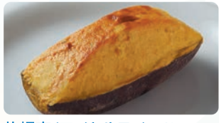
札幌市/ロイヤルスイーツ クリーム、バターをふんだんに使用したしっとりなめらかなスイートポテト。①スイートポテト(量り売り) (100g当り) 税込421円