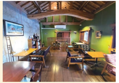
左: 試作を重ねたオリジナルのケーキ、秋限定「モンブラン」と「今月のコーヒー」のセット(1,180円)