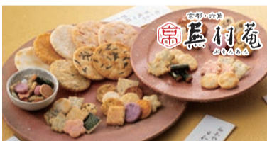
京都・蕪村庵特化の新たな売場展開 <蕪村庵>