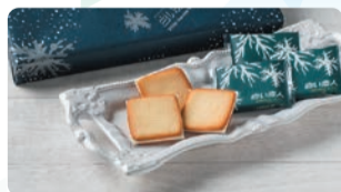
札幌市/ISHIYA 香ばしく焼上げたサクサクのラング・ド・ソヤに、「白い恋人」のためにブレンドされたオリジナルチョコレートサンドしました。①白い恋人 (18枚入) 税込1,555円