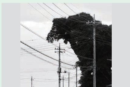
ペンネーム ガメラさん

散歩していたら、大きな木がゴジラの横顔のように見えて思わずパシャリ！風に揺れると歩いているように見えて、なかなか怖かったです（笑）