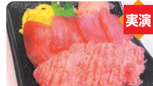
神奈川/むらさ伎 ①まぐろサービス丼 (1折) 税込783円