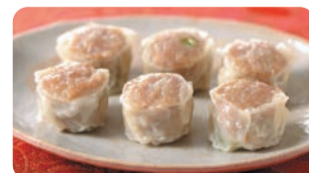
神奈川/崎陽軒 ①おいしさ長持ち昔ながらのシウマイ(24個入) (6個×4袋、1箱) 税込1,110円