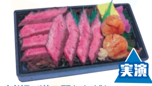
中川町/道の駅なかかわ 大粒ホタテとたっぷりステーキの贅沢な弁当です。①猿払産ホタテと北海道牛ステーキ弁当 (1折) 税込1,998円