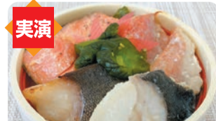
群馬/お魚のやまなか屋 ①3種の焼き魚弁当 (1折) 税込1,080円