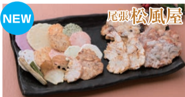
海・山の素材を、姿そのままに、食感や風味を楽しめます <尾張松風屋>