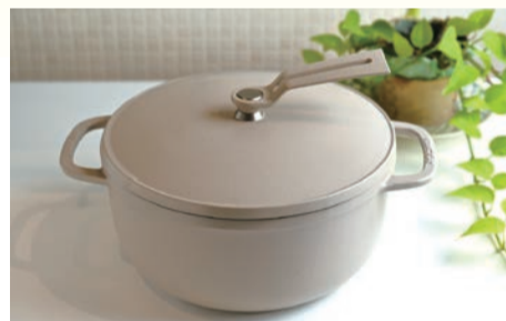
(マットリネンベージュ) 22cm 30,800円

軽量化と加熱時間の短縮を実現した新時代鋳物ホーロー鍋。素材本来の味を引き出す無水調理と、独自の瞬間蒸発性能で、料理の可能性がさらに広がる!