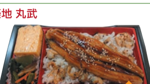
①穴子入深川めし (1折) 税込1,296円