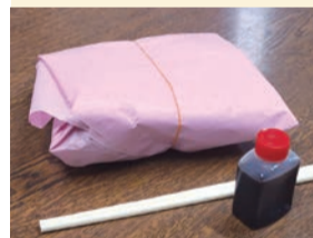
左: 後がけソースで自分好みの味わいに