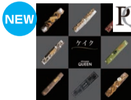
県内を代表するパティスリーが宇都宮店に登場 フランスパリに1819年創立 ショコラティエの老舗 <クィーン洋菓子店>