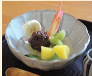
「ミニあんみつ(ランチ注文で200円)」