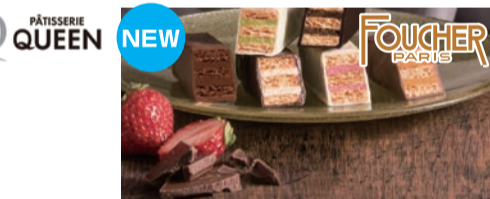
フランスパリに1819年創立 ショコラティエの老舗 <フーシェ>